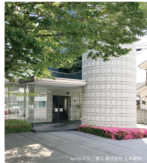
echo ビル / 施工 株式会社 土本建設